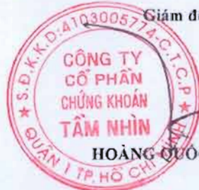
HOÀNG QUỐC HÙNG